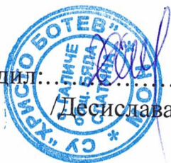
ГРАФИК ЗА РАЗПРЕДЕЛЕНИЕ НА ЧАСОВЕТЕ В ГЦОУД V- VII клас за ВТОРИ срок на учебната 2023 – 2024 г.